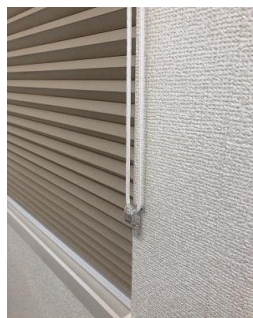
ループコードが張った状態で取付け、そのまま操作が可能