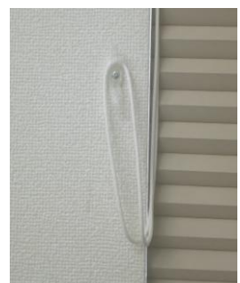
紐止め具でループコードが下がらないようにまとめる

壁が木材でない場合や、ブラインド近くにフックを固定できる壁がない場合は、お子様の手の届か居ない高さで、クリップ等でまとめていただくことを推奨しております。