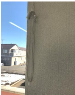
紐止め具を2個取付け、コードを巻きつける